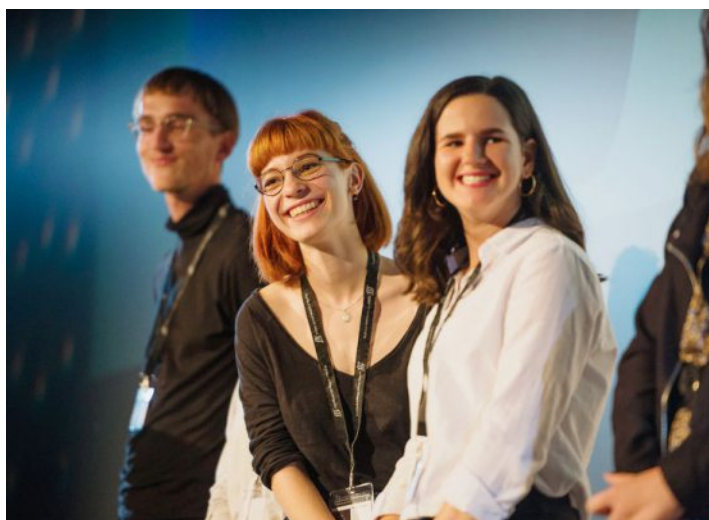
Les personnes motivées ont jusqu'au 24 août pour se manifester.