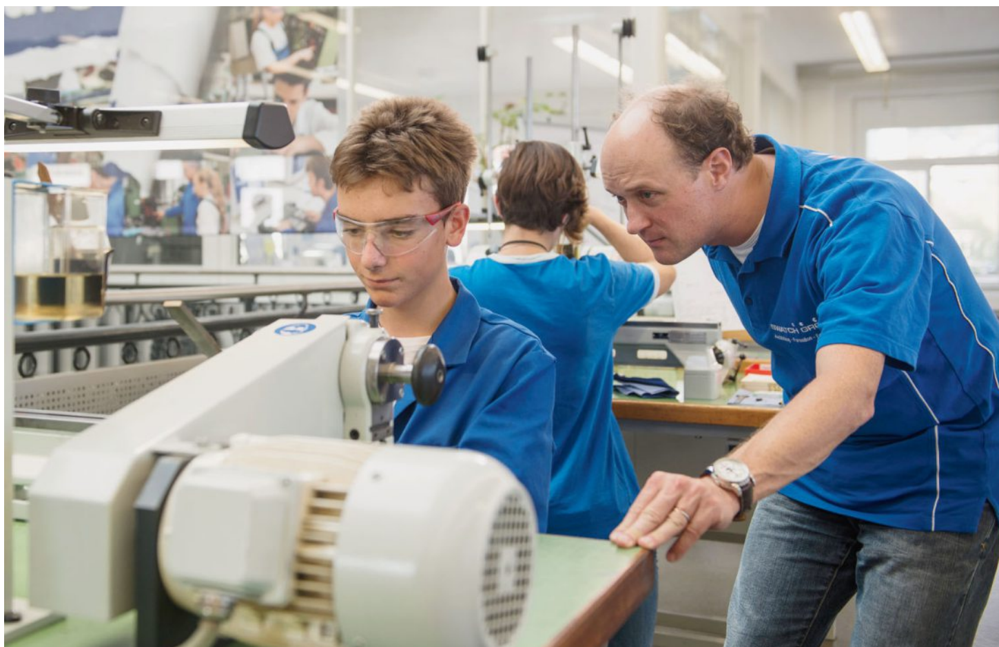
En 2017, 175 jeunes suivaient une formation dans un métier technique, plus que dans tout autre secteur d'activité. ARCHIVES

La région Bienne-Seeland est loin d'être un bastion de la formation professionnelle. Sur 100 habitants, seuls 2,61 décident d'y effectuer un apprentissage. C'est nettement moins que dans les autres parties du canton. Le Jura bernois, qui signe le meilleur score, affiche par exemple un taux de 4,74, alors que la moyenne cantonale s'élève à 3,62.